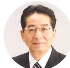
仙谷 由人 (元官房長官)